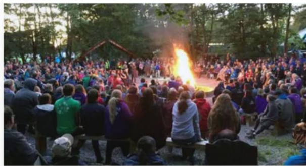
Rundt 3.000 speiderledere fra hele verden var samlet i Gilwell Park utenfor London i dagene 9.–11. september 2019 i anledning 100-års jubileet for det såkalte Gilwell ledertreningsprogrammet. Her et glimt fra det store åpningsleirbålet.

Baden-Powell fant derfor å måtte etablere en egen «Ledertrenings-skole», og eiendommen Gilwell Park nord for London ble skjenket som en gave av en skotsk speiderleder for dette formål. Det første lederkurs ble avholdt i september 1919, og totalt henimot ett tusen «Gilwell-kurs» hadde vært avholdt på dette senteret da man i september i år kunne feire et stort 100-års jubileum for treningsprogrammet i Gilwell Park.