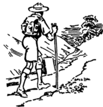
Mange logebrødre har vandret på speiderveien