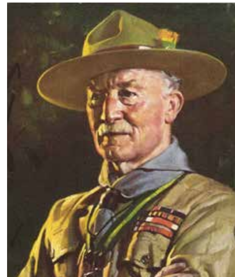
Baden-Powell var ikke frimurer selv, men...

medmenneske. Utviklingen gikk fra Aspirantens nølende skritt til den modne Rover som har hele verden for sine føtter. I den nå-gjeldende Speiderloven heter det bl.a. at «En speider ....søker sin tro og respekterer andres, .. kjenner ansvar for seg selv og andre,... er hjelpsom og hensynsfull, ...er en god venn,... er ærlig og pålitelig,...tenker og handler selvstendig og prøver å forstå andre,...arbeider for fred og forståelse mellom mennesker».